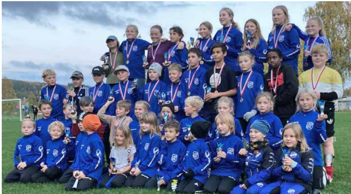
Alla lagen samlade vid fotbollsavslutningen på Lissvallen i Näsåker.