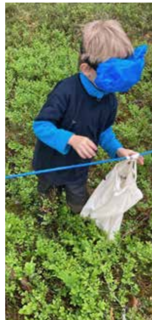
Vincent Ek kände igen alla föremål.