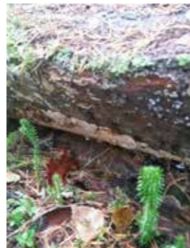
Skinnsvampen Rynkskinn.