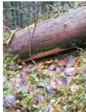
Den sällsynta arten Blackticka.