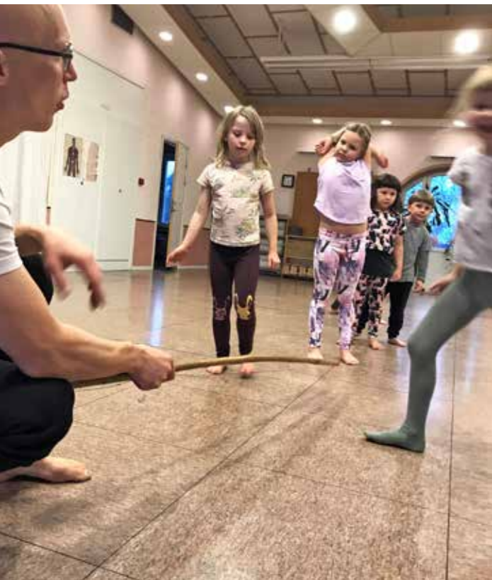
Rörelse i fokus på Näsåkers capoeira för barn.