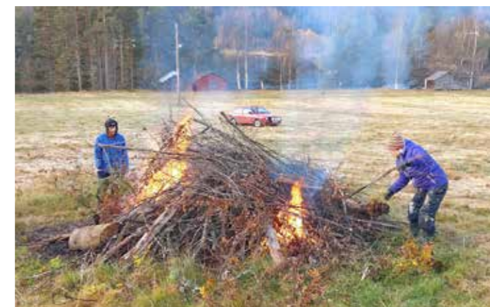
Nipröjarna eldar ris i Hotellfällan.