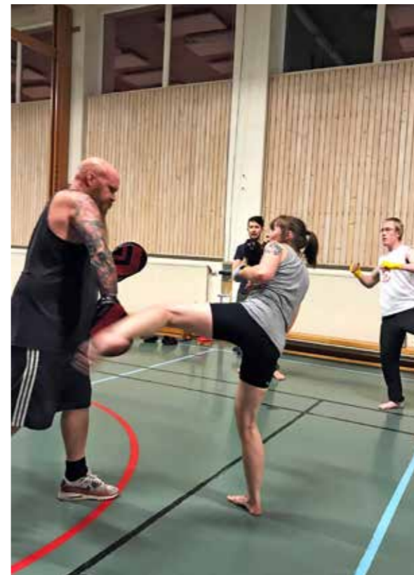
Högt tempo, hög musik och högt till tak när Fightclub intar idrottshallen.