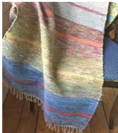
Även i år kommer vi att delta i julmarknaden söndag 4 december på Hembygdsgården.