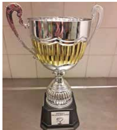
Pokalen för segern i PROvetarna!