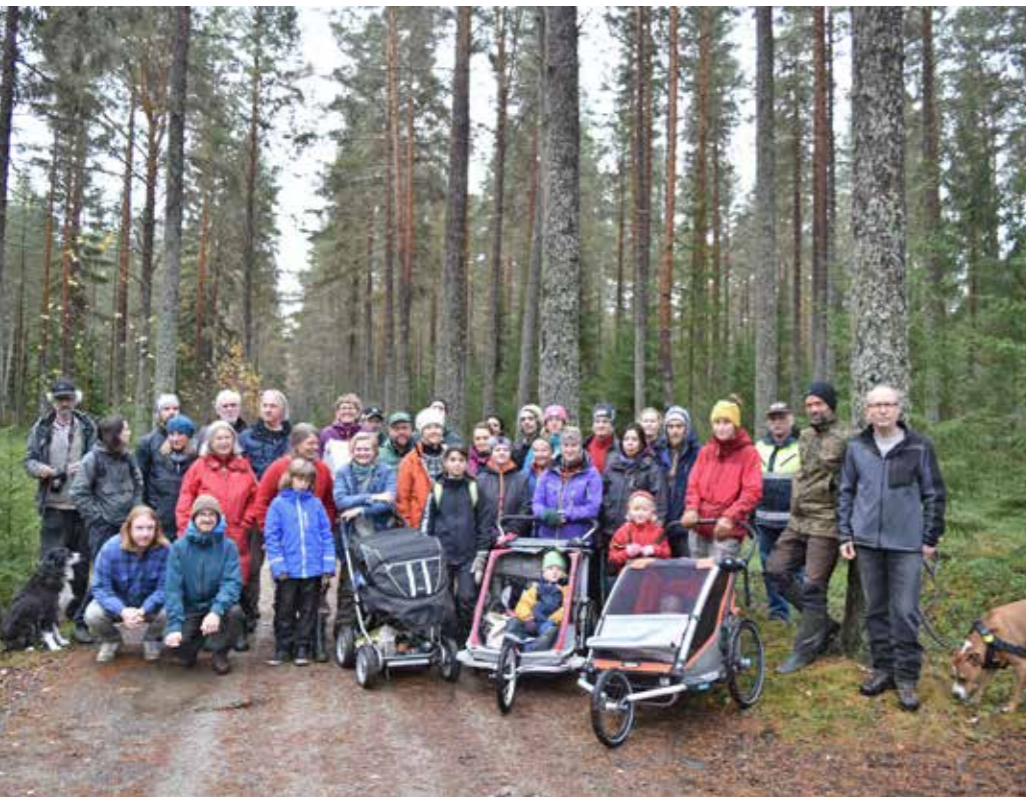
Unga som gamla bybor slöt upp inför genomgången i vår skog. Alltid kan man lära sig något nytt om naturen eller historien från förr.