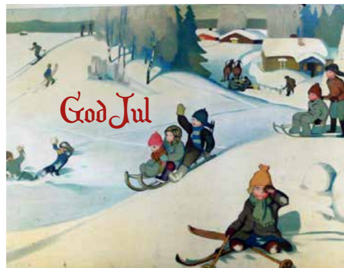
Illustration: Martta Wendelin.